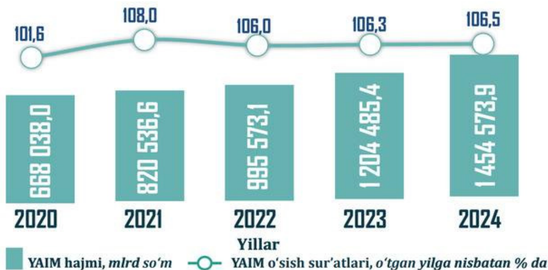
3-rasm. O'zbekiston Respublikasi bo'yicha yalpi ichki mahsulot dinamikasi.

Tadqiqot natijalari norasmiy iqtisodiyot ko'lamini qisqartirish uchun tizimli va muvozanatli yondashuv zarurligini ko'rsatadi. Soliq siyosatini takomillashtirish, biznes yuritishni soddalashtirish, hisob-kitoblar va hujjatlar aylanishini raqamlashtirish, davlat institutlarining shaffofligini oshirish hamda aholining huquqiy savodxonligini yuksaltirish ustuvor yo'nalishlar qatoriga kiradi. Yanada rasmiylashtirilgan iqtisodiyotga o'tish nafaqat nazoratni kuchaytirishni, balki tadbirkorlik faoliyatini ixtiyoriy qonuniylashtirish uchun rag'batlar yaratishni ham talab etadi.