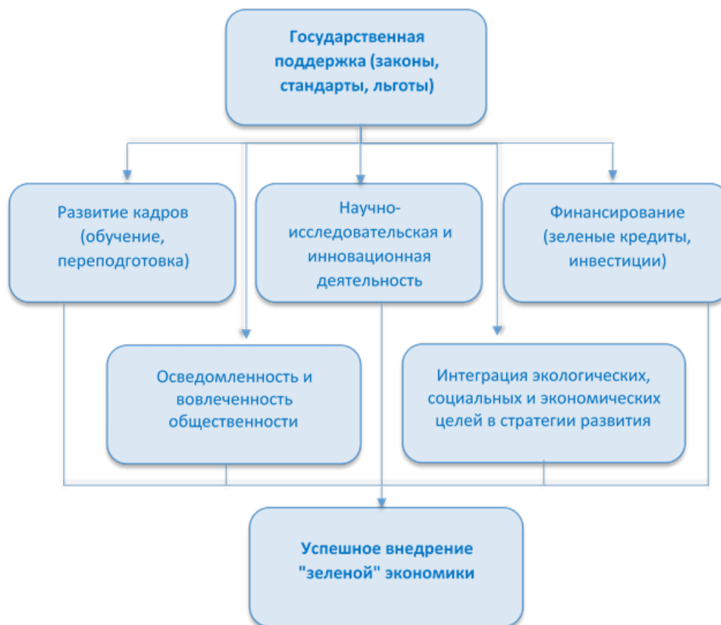
Рис.3 Комплексный подход к «зеленой» экономике как фундамент устойчивого развития

В условиях глобальных вызовов, связанных с истощением природных ресурсов, изменением климата и социально-экономическими трансформациями, переход к зелёной экономике становится неотъемлемым условием устойчивого развития как на национальном, так и на глобальном уровнях. Проведённый анализ свидетельствует о том, что успешное внедрение принципов зелёной экономики требует комплексного и системного подхода, который учитывает взаимосвязь экономических, экологических и социальных аспектов (см. рис.3). Экологическая устойчивость не может быть достигнута без одновременного обеспечения экономической эффективности и социальной справедливости, что подчеркивает необходимость интегрированного взгляда на развитие.