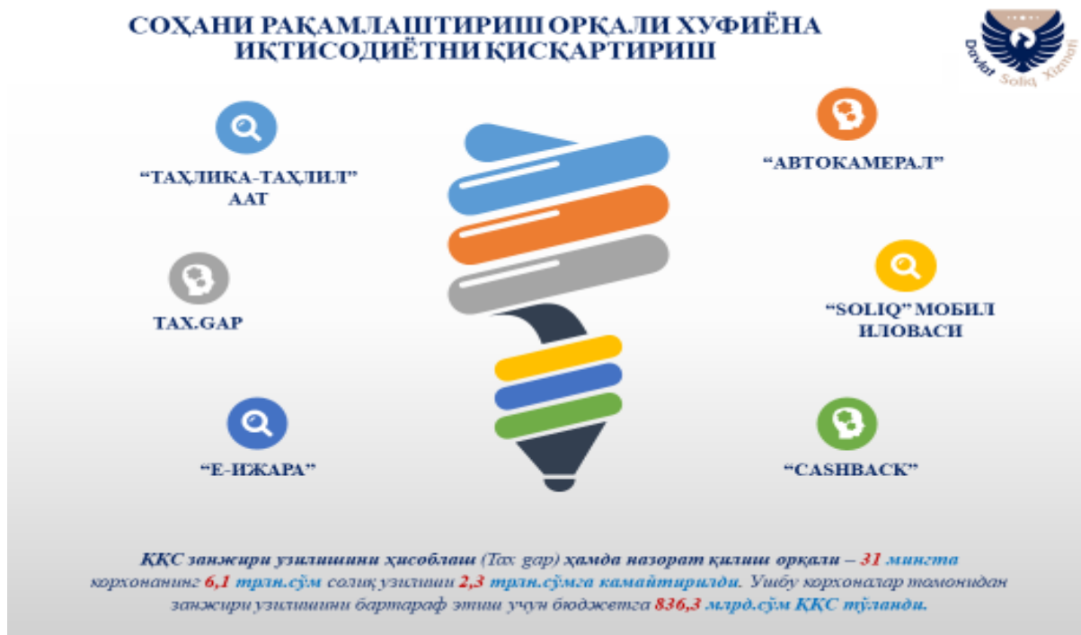
2-rasm. Soliq tizimini raqamlashtirish orqali xufiyona iqtisodiyotni qisqartirish usullari 4

Ma'lumki, iqtisodiyotda norasmiy sektor ko'lamining kengayib borishi albatta davlat fiskal manfaatlariga zarar etkazadi va shu orqali uning ijtimoiy xizmatlarni ko'rsatish qobiliyatini zaiflashtiradi. Yashirin iqtisodiyot adolatli jamiyat va sog'lom raqobat muhitini buzadi. Norasmiy bandlik, ijtimoiy badallarni to'lamaslik fuqarolarning keksalik chog'idagi ijtimoiy ta'minotiga putur etkazadi. Keng tarqalgan norasmiy iqtisodiyot jamiyatda jinoyatchilikni ham kuchaytiradi. Shu sababli O'zbekistonda xufiyona iqtisodiyotga qarshi kurashishda barcha vositalar, shu jumladan fiskal instrumentlardan keng foydalanish yo'lidan borilmoqda.