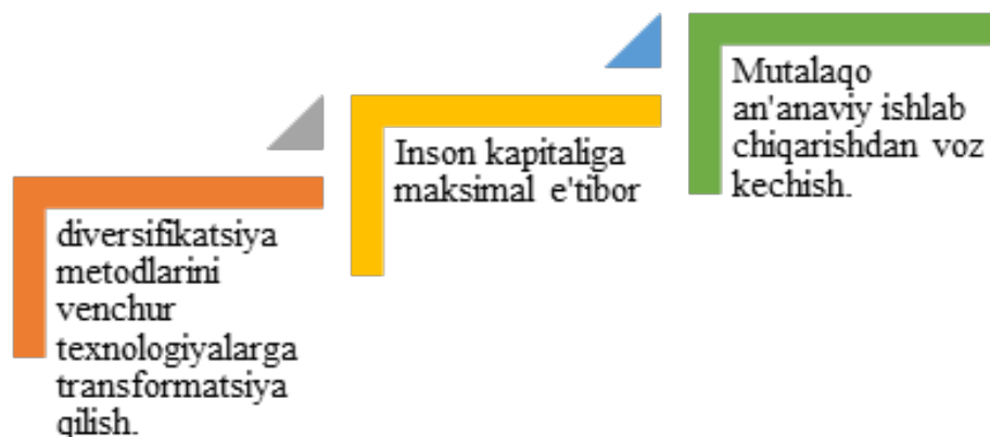
1-rasm. Yevropa Ittifoqiga ko'ra ishlab chiqarishni innovatsiyalashtirishning asosiy bosqichlari.[4]

Kichik biznes subyektlari faoliyatini innovatsion rivojlantirish – bu ishlab chiqarish jarayonlarini yaxshilash va raqobatbardoshlikni oshirish maqsadida yangi texnologiyalar, usullar va tizimlarni joriy etish jarayonidir. Bu jarayon ishlab chiqarish samaradorligini oshirish, mahsulot sifatini yaxshilash, xarajatlarni kamaytirish va yangi bozorlarga chiqish imkoniyatlarini yaratish uchun muhimdir(1-rasm).