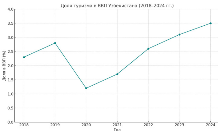
Рис. 2. Динамика вклада туризма в ВВП Узбекистана (2018–2024 гг.) 5

Перспективы развития туризма в Узбекистане тесно связаны с внедрением инновационных технологий, улучшением инфраструктуры и экологической осознанностью. Диверсификация туристических предложений, акцент на уникальные впечатления и повышение уровня сервиса позволят Узбекистану укрепить свои позиции как одного из ведущих туристических направлений Центральной Азии (Рис. 2).