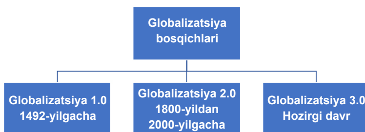
1.1-rasm: Globalizatsiya bosqichlari

Shunday ishlarni amalga oshirgan iqtisodchi olimlardan biri Tomas Fridman hisoblanib, u o'zining "Tekis dunyoga yondashuv" asarida dunyo tarixini uchga bo'lgan 1 :