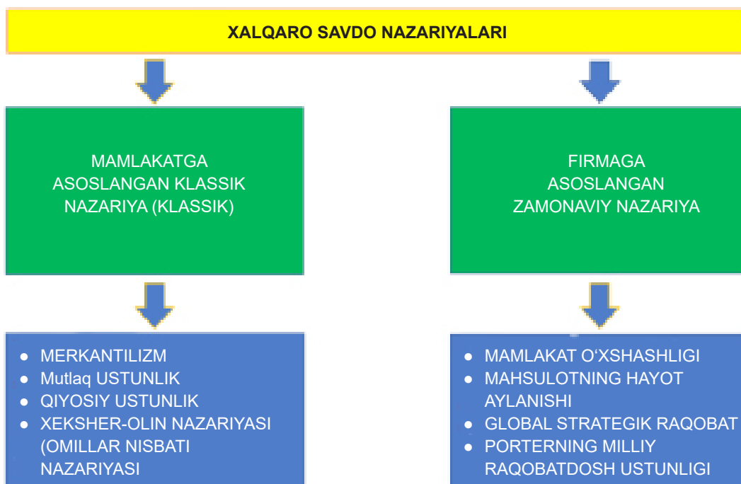
1.2-rasm: Xalqaro savdo nazariyalari

Tomas Fridmanga ko'ra Globalizatsiyaning birinchi bosqichida, millatlar global kenglikka hukmronlik qilishgan, ya'ni mustamlakachilik davri deb atamoqchi bo'lgan. Globalizatsiyaning 2-bosqichida transmilliy kompaniyalar yuqoriga ko'tarilgan va global rivojlanishga turtki berdi. Globalizatsiyaning hozir 3-bosqichini texnologiya boshqarmoqda. Barcha sohalarni tadqiq etishda ularning evolyutsiya jarayonlarini o'rganish muhim ahamiyat kasb etganidek, zamonaviy global savdo qanday rivojlanganligini yaxshiroq tushunish uchun mamlakatlar tarixiy ravishda bir-biri bilan qanday savdo qilganligini tushunish muhimdir. Global savdo mexanizmlarini tushunish, davlatlarning savdo siyosatlarida qanday qilib muvaffaqiyatga erishganligi ustida ko'plab ilmiy yondashuvlar mavjud. Olimlar global savdo mexanizmlarini tushunish uchun yetarlicha ilmiy nazariyalar yaratishgan. Mamlakat nuqtayi nazaridan kelib chiqadigan asosiy tarixiy nazariyalar klassik nazariyalar deb ataladi. Yigirmanchi asrning o'rtalariga kelib, nazariyalar savdoni mamlakat nuqtayi nazaridan emas, balki firma nuqtayi nazaridan tushuntirishga o'ta boshladi. Ushbu firma yoki kompaniyaga asoslangan nazariyalar firmaga asoslangan zamonaviy nazariya deb atalgan. O'z o'rnida, klassik va zamonaviy toifalarning ikkalasi ham bir nechta xalqaro tashqi savdo nazariyalardan iborat.