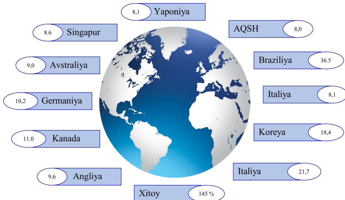
1-rasm: Yashirin iqtisodiyotning jahon mamlakatlari bo'yicha ko'rsatkichlari

Yashirin iqtisodiyotni tadqiq qilishda jahon mamlakatlari bo'yicha o'rganilganda quyidagi ko'rsatkichlar quyidagi diagramma asosida keltirilgan. Yashirin iqtisodiyotning ulushi jahon mamlakatlari, jumladan, AQShda 8,0%, Braziliyada 36,5%, Ispaniyada 21,7%, Italiyada 19,5%, Portugaliyada 18,5%, Koreyada 18,4%, Xitoyda 14,5%, Kanadada 11,0%, Germaniyada 10,2%, Buyuk Britaniyada 9,6%, Avstraliyada 9,0%, Singapurda 8,6% va Yaponiyada 8,1%ni tashkil qildi. (1-rasm)