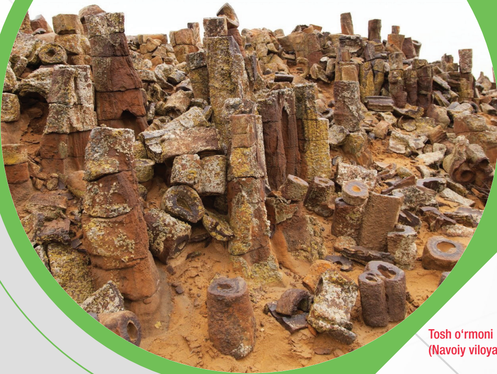
Tosh o'rmoni (Navoiy viloyati)