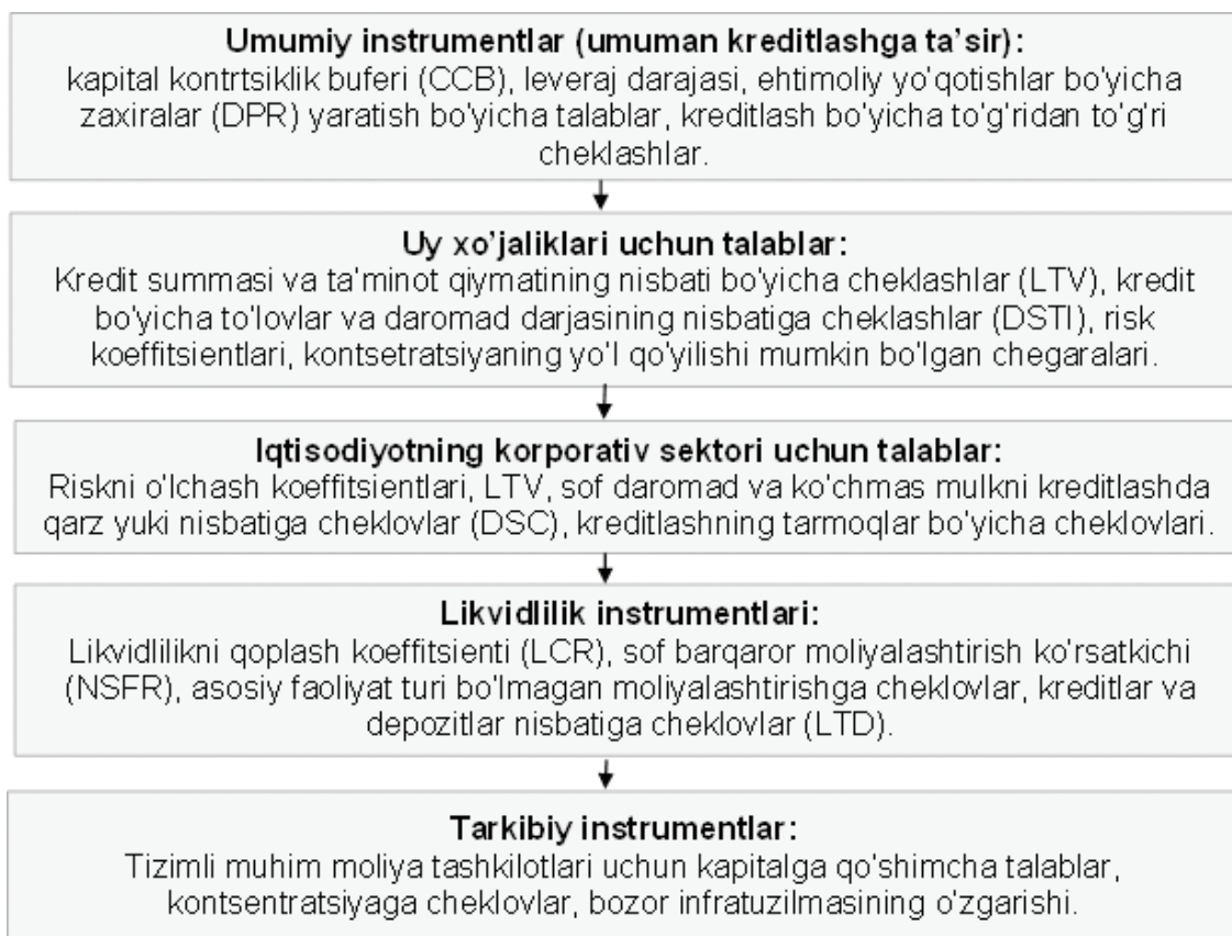
2-rasm: Makroprudensial siyosatning keng tarqalgan instrumentlari

Har bir instrument qo'llanilganida amalga oshiriladigan xarajatlar, ehtimoliy salbiy ta'sirlar hisobga olingan holda, tizimli riskning yuzaga kelishini oldini olishga qaysi instrumentni qo'llash samaraliroq bo'lishi hisoblab chiqiladi. Boshqa barcha hollarda an'anaviy mikroprudensial ta'sirlarga muvofiq keladigan eng oddiy instrument tanlanadi. Bu bankning administrativ xarajatlarini kamaytirib, regulyator xodimlarining faoliyatini soddalashtirishga xizmat qilishi lozim.